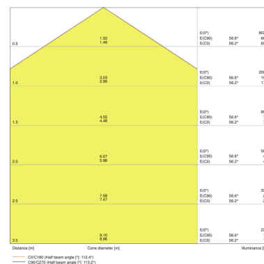
PANEL VALUE 1200x600 TPB 65 W 4000 K WT